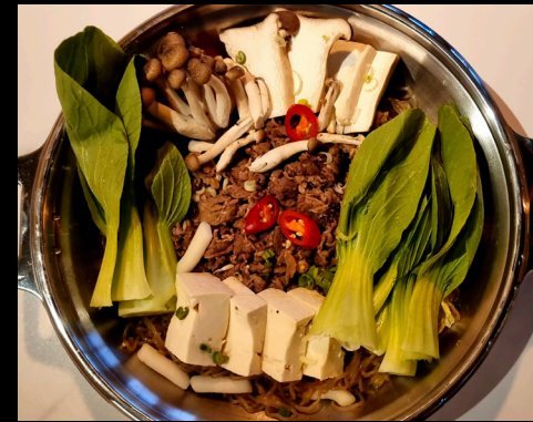
불고기 전골 | Bulgogi Beef Hotpot

Hotpotin mukana kuuluu riisi, 2 lisuketta ja kimchi, kaikissa hotpot-ruoissa sis. myös riisikakkuja