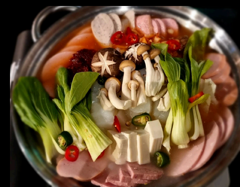
부대찌개 | Sausage Army Stew 🔥

Sypressi hotpot – naudanlihaa ja kasviksia puisessa höyryttimessä (L, G) Steamed beef & veggies in a cypress wooden box with no liquid broth