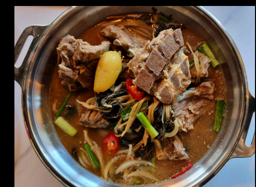
감자탕 | Gamza-tang

Army stew tulisilla makkaroilla ja ramenilla (L) Assorted sausages & veggies served with ramen