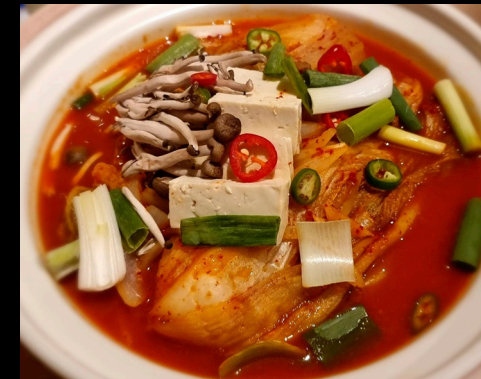
등갈비 김치전골 | Pork Rib Kimchi 🔥

Kana hotpot riisikakuilla ja juustolla (G) Boneless chicken & veggies with cheese topping