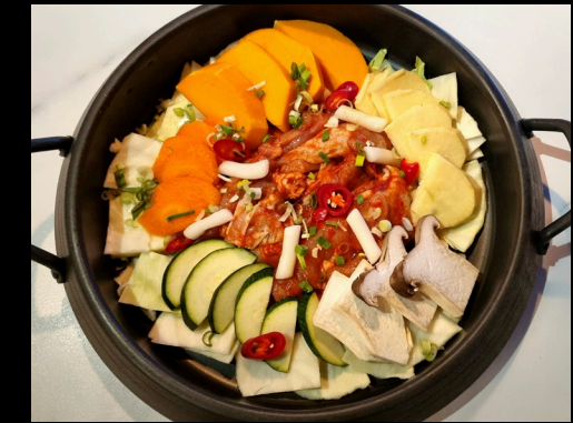
닭갈비 | Chicken Hotpot

Bulgogi-naudanliha hotpot (L, G) Soy sauce base, zapchae noodles, tofu & veggies