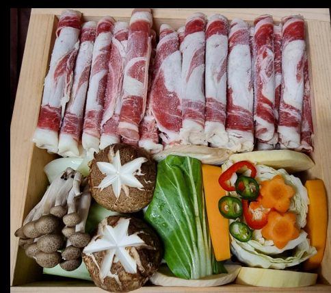
편백찜 | Cypress Hotpot

Mereneitä sisältävä hotpot (L, G) Assorted seafood & veggies