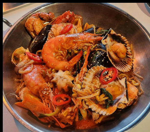
해물 전골 | Seafood Hotpot