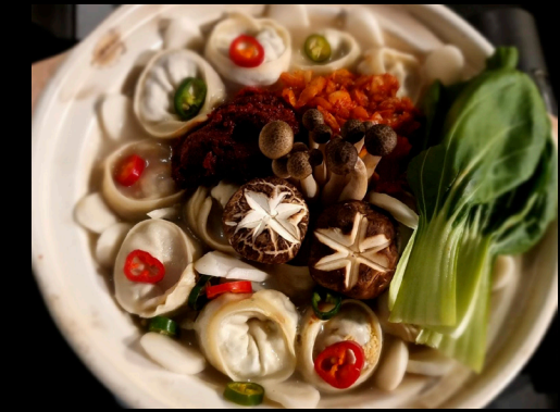
야채 만두 전골 | Vegetable & Dumpling Hotpot

Hot pot porsaankyljellä ja kimchillä (L, G)